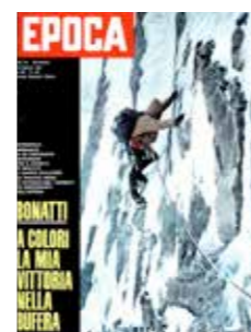
Come il ragazzo dell'impossibile