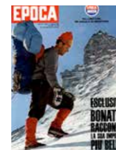
Perché l'ho fatto, che cosa ho sentito