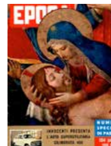
Arrivederci Cerro Torre