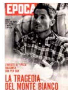
Da nove anni sognava questo inferno