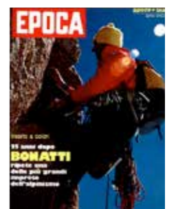
Bonatti sul Grand Capucin