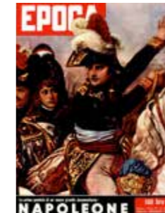
Scomparvero tra gli urli del vento