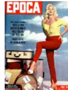
Cinque notti sull'abbiso

Lo ritroviamo da protagonista un anno dopo nella scalata della parete Ovest del Dru , nel massiccio del Monte Bianco, ed è da qui che inizia la nostra storia.