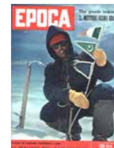
Vittoria italiana Sul Gasherbrum IV