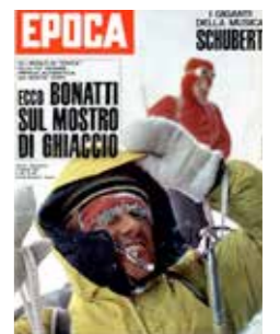
In questo inferno cerco la pace